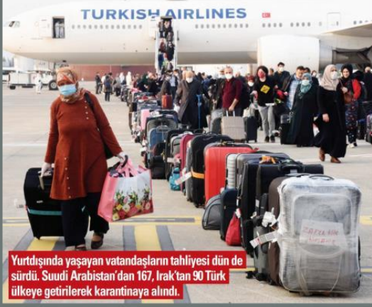
Yurtdışında yaşayan vatandaşların tahliyesi dün de sürdü. Suudi Arabistan'dan 167, Irak'tan 90 Türk ülkeye getirilerek karantinaya alındı.

Almanya'dan tahliye edilen ve Muğla'daki yurttaki vatandaşlar, "5 yıldızlı otel konforunda kalıyoruz. Böyle karantinaya can kurban" dedi.