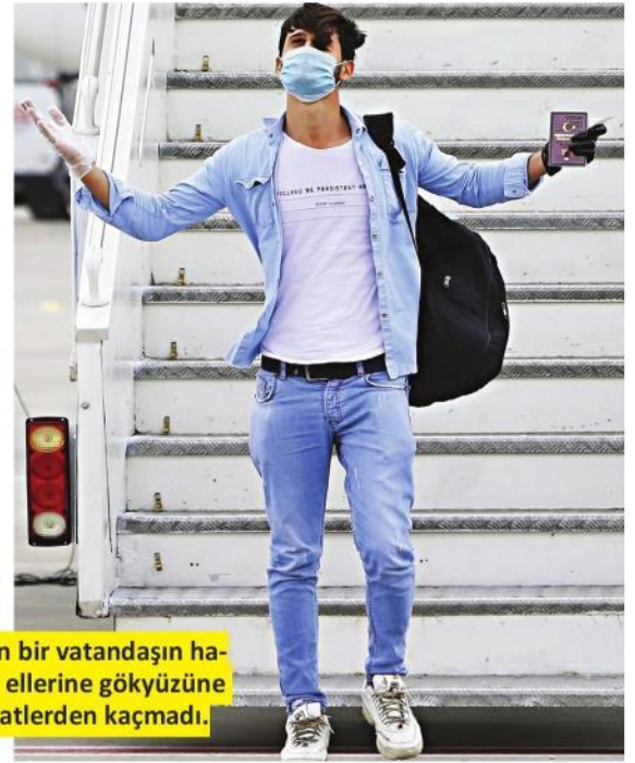
Suudi Arabistan'dan getirilen bir vatandaşın havaalanında uçaktan inerken ellerine gökyüzüne kaldırarak şükretmesi dikkatlerden kaçmadı.